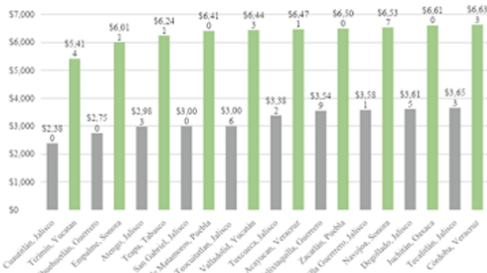
Gráfica 3. Sueldos más bajos: policías SUBSEMUN y no SUBSEMUN

Nota: Debido de la diferencia que existió en el suministro de información de los municipios no beneficiarios del SUBSEMUN, existe la posibilidad de que se registren sueldos más bajos a los reportados para este diagnóstico.