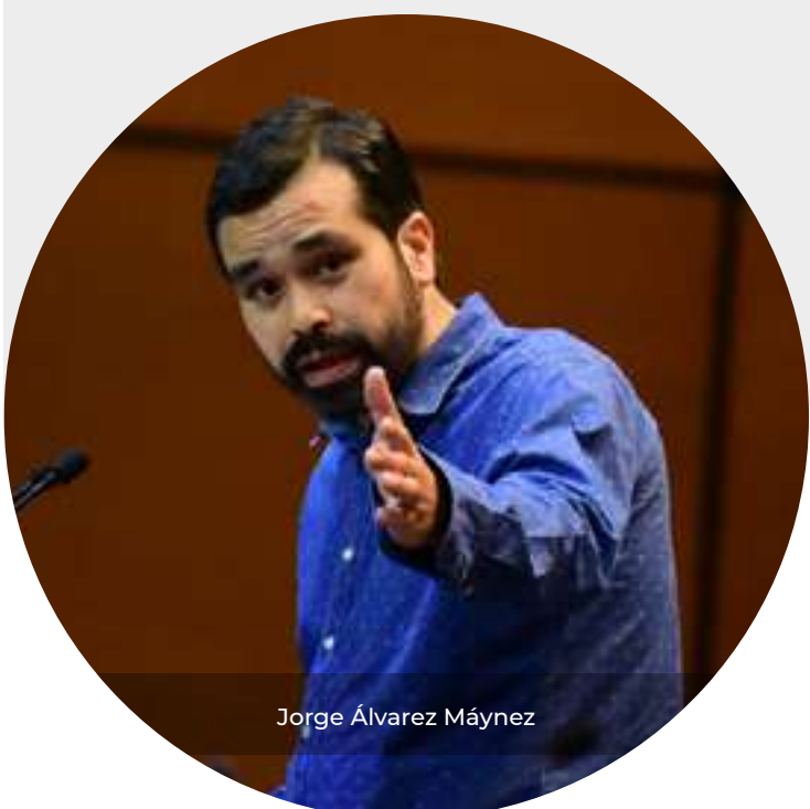
Jorge Álvarez Máynez

Representante Ciudadano Jorge Álvarez Máynez