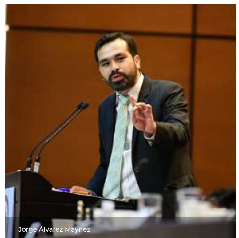
Jorge Álvarez Máynez

El coordinador, Jorge Álvarez Máynez , cuestionó al director de la CFE a seguir apostando por el carbón y subsidiar energías contaminantes cuando las energías limpias son cada vez más accesibles. Por eso, contrastó que frente al bando que quiere atar al país al pasado y condenar el futuro de millones de seres humanos, en la Bancada Naranja trabajaremos por las energías limpias y renovables.