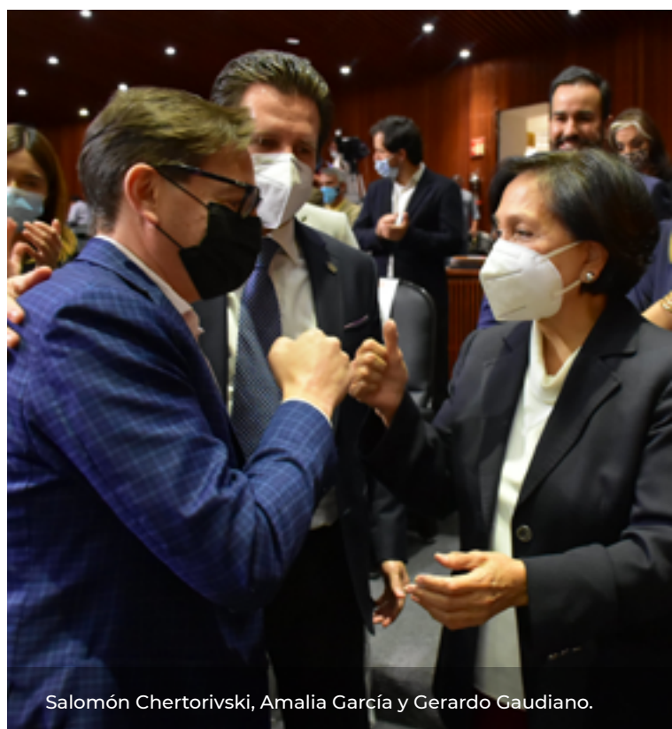
Salomón Chertorivski, Amalia García y Gerardo Gaudiano.