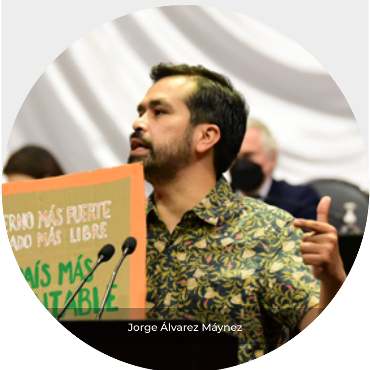
Jorge Álvarez Máynez

Representante Ciudadano Jorge Álvarez Máynez