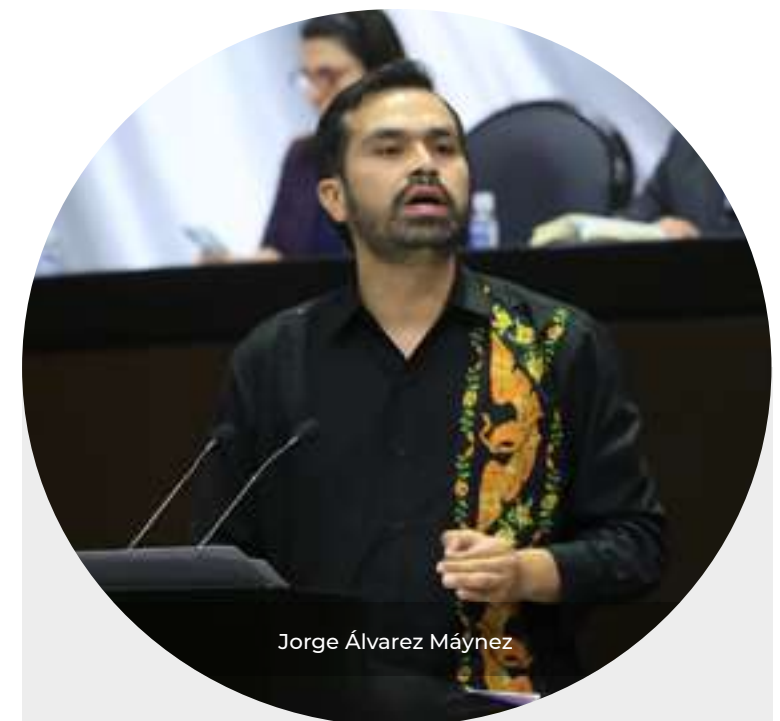
Jorge Álvarez Máynez