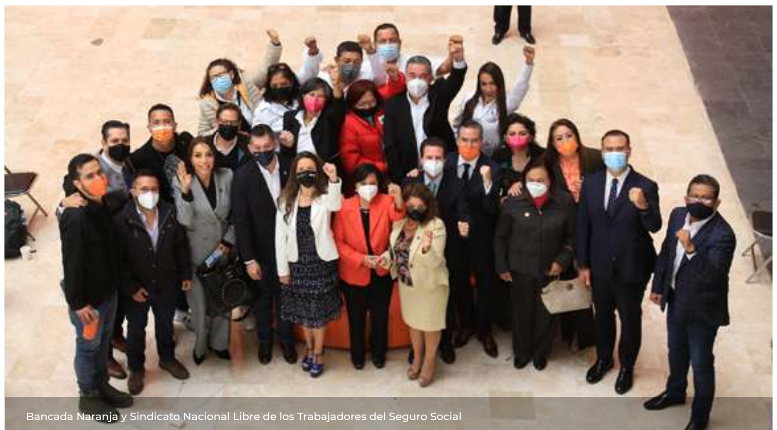
Bancada Naranja y Sindicato Nacional Libre de los Trabajadores del Seguro Social

En la Bancada Naranja reconocemos el esfuerzo que ha realizado el personal de salud durante la atención a la pandemia y por eso nos reunimos con Integrantes del Sindicato Nacional Libre de los Trabajadores del Seguro Social de diversas entidades del país, para conocer sus experiencias, sus carencias para realizar su trabajo y escuchar sus preocupaciones y necesidades en nuestro Parlamento Abierto.