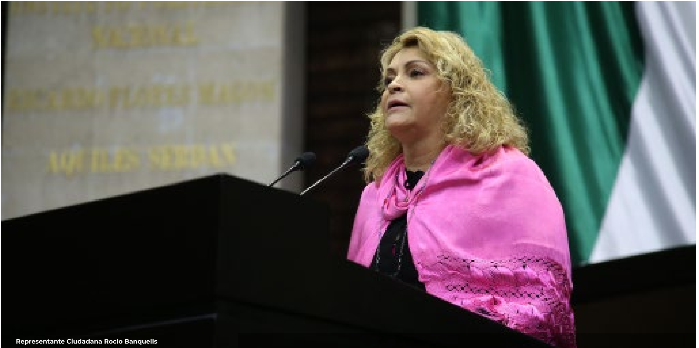
Representante Ciudadana Rocío Banquells

Iniciativas y puntos de acuerdo por temas de interés