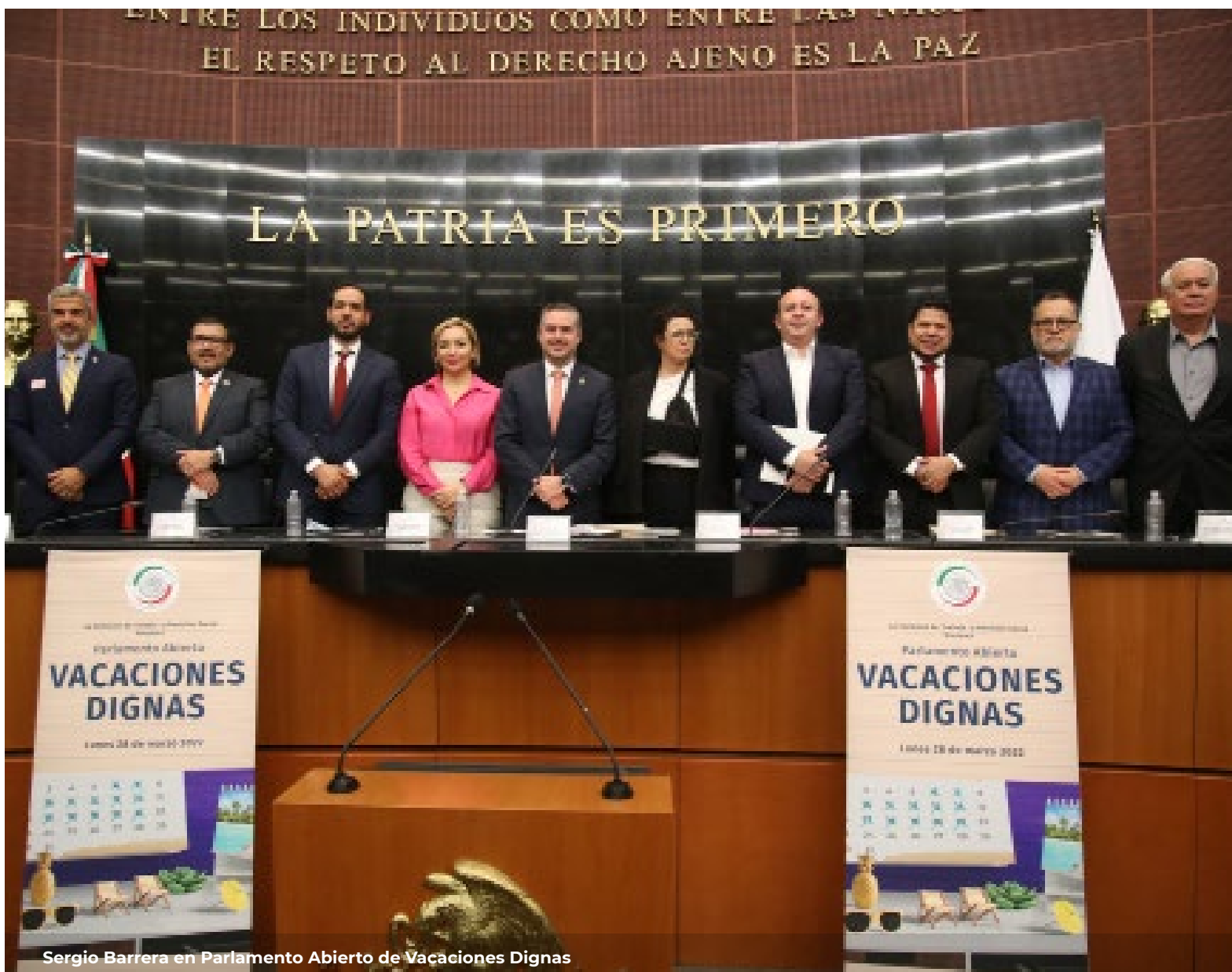
Sergio Barrera en Parlamento Abierto de Vacaciones Dignas

El representante Sergio Barrera en representación de la Bancada Naranja participó en el Parlamento Abierto de Vacaciones Dignas Ya. Su propuesta fue duplicar de 6 a 12 días las vacaciones después del primer año laborado y añadir 2 días cada año hasta llegar a 20. Las y los trabajadores mexicanos reciben menos días de vacaciones pagados que en cualquier otro país de América Latina.