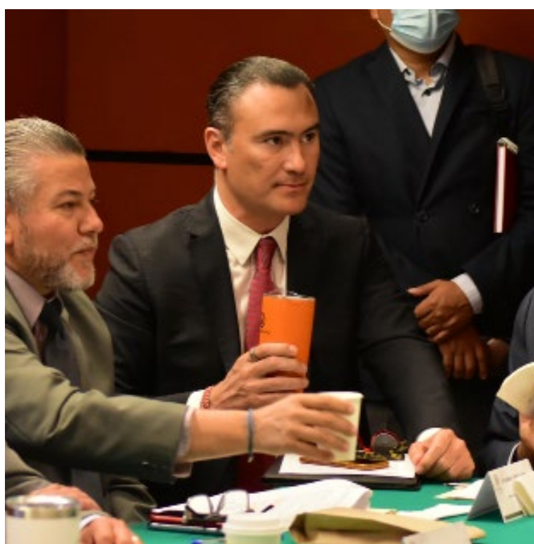
Proceso de dictaminación de la Reforma Eléctrica.

Defendimos nuestra propuesta por una Pensión Rural Digna para 16 millones de personas trabajadoras del campo. Morena y los demás partidos les negaron el derecho a un retiro digno.